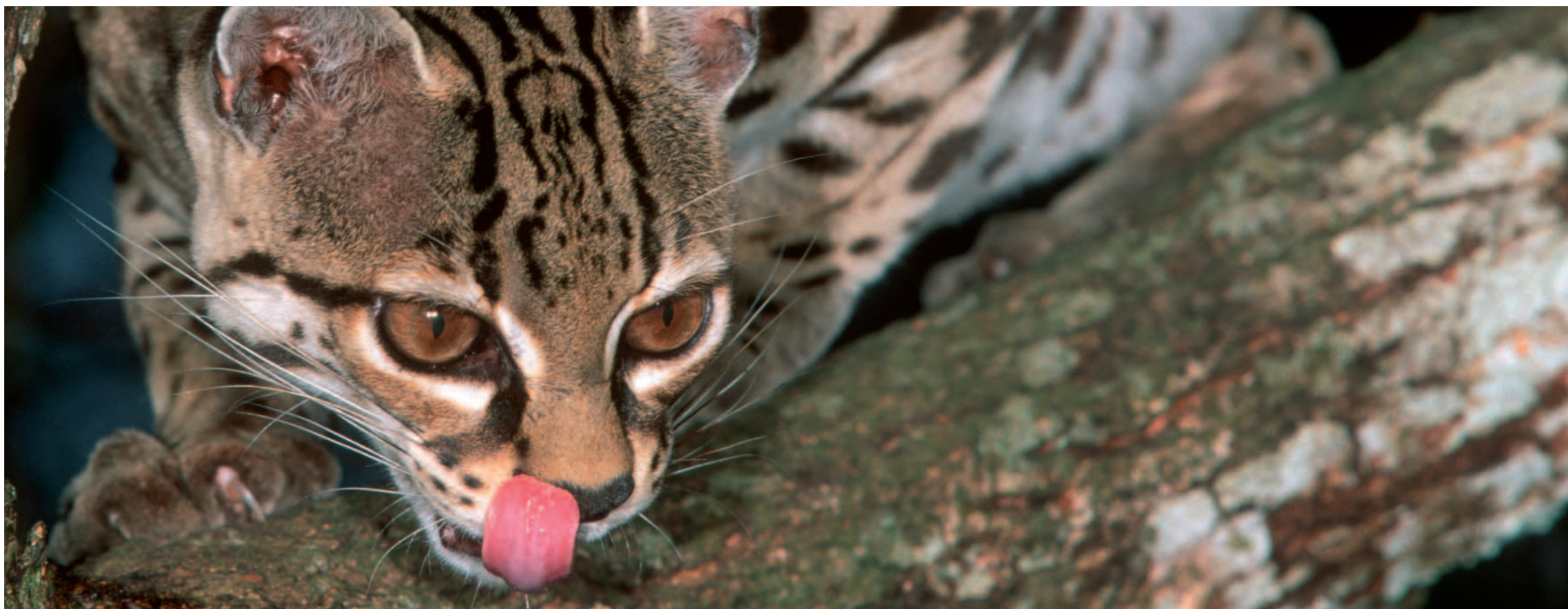
Mit GMT-Lösungen behalten Sie immer das Wesentliche im Visier: Ihre Ziele.

So können Sie sich jederzeit darauf verlassen, dass Sie bekommen, was Sie für Ihre Unternehmensführung benötigen: aussagekräftige Berichte, Bilanzen, Analysen und Prognosen.